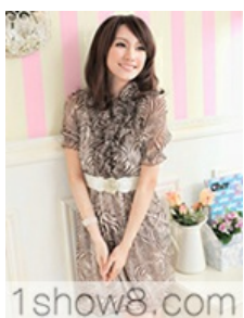
1show8.com B-1292 ýÄ ĩÿpCÙ :÷2... 280 C 6ĭ | -p